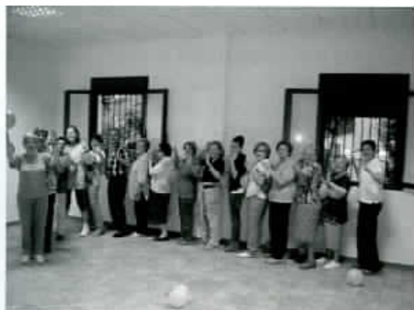
Taller de risoterapia