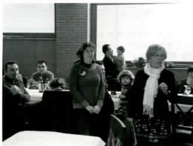
— Presentacion de N° 28 de Zimbeler en la comida de San Antón.