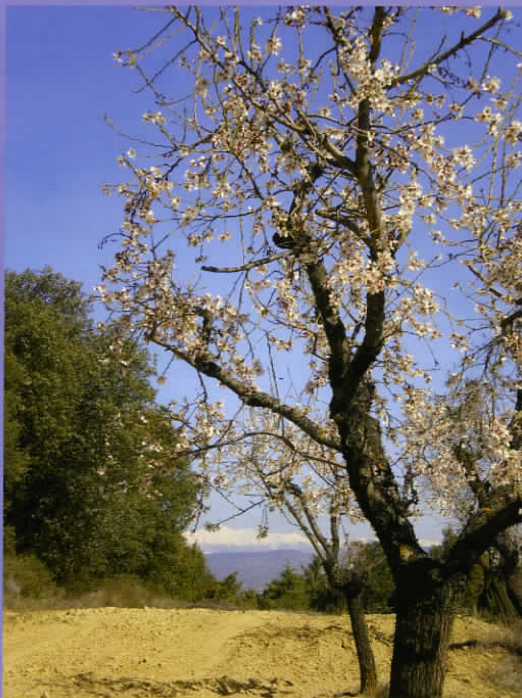
Somontano en primavera, Cotiella nevado

Escanea este código con tu dispositivo móvil