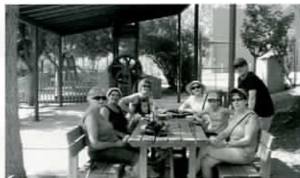
Andada a Pozán de Vero.