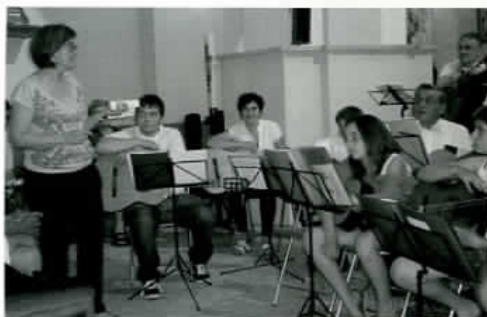
Concierto de guitarra por Aguisoba.