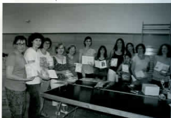
Taller de iniciación al "scrap"