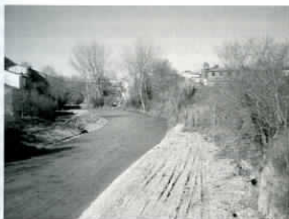
Limpieza de puente a puente