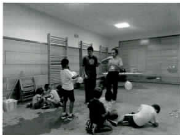
Taller infantil "Cuca-Party"