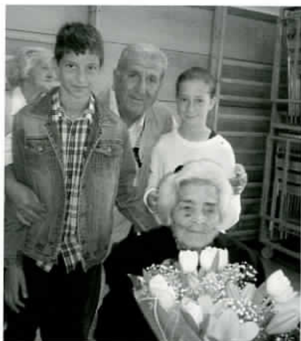
La Asociación Cultural le entrega unas flores