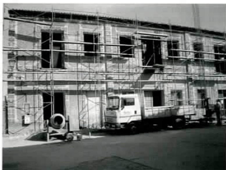
Obras en el Sindicato