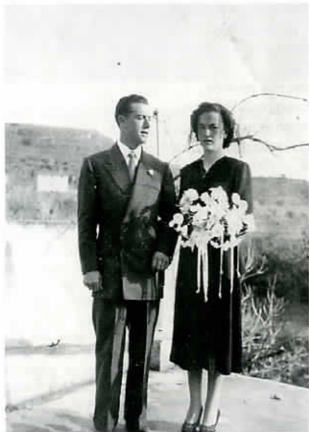
Y entre paseos y bailes llegó la boda... 13 de diciembre de 1950.