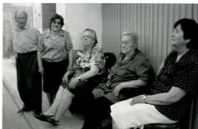
Vecinos en calle Ra Zequia.