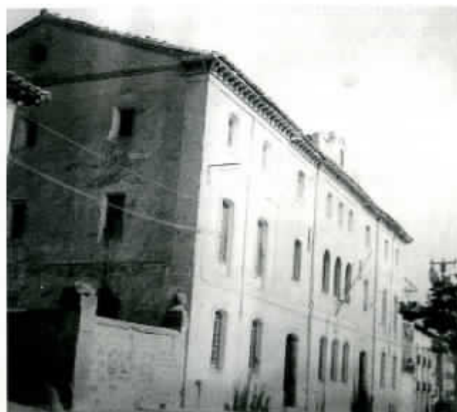
Antigua Casa-escuela de Ayerbe

Aso, Yosa y Betés, que Dios nos libre de esos tres; a los de Acumuer esquiragüelos los llaman; a los de Larrés catalanes; a los de Cartirana moscas; narigudos a los de Aurín; mochuelos a los de Sarsamarquello; y de Vicién se dice que con un huevo comen cien y aún sobra para Tabernas y Sangarrén; a los de Latas millonarios los apodan.