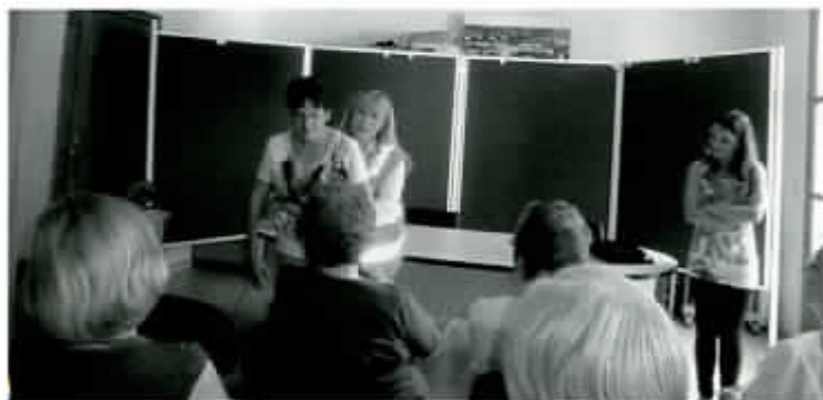
Charla primeros auxilios Cruz Roja