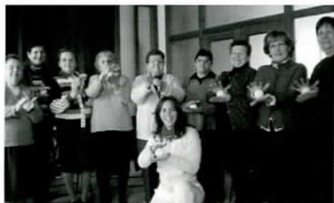
— Taller automasaje (AFAMMER ALTOARAGON).