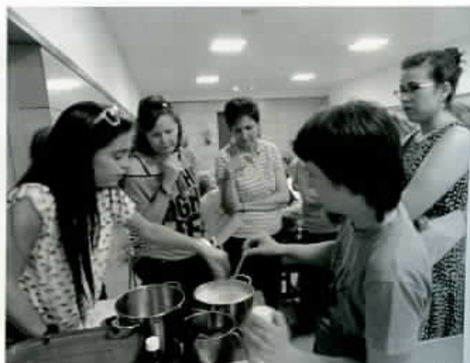
Cursos de cosméticos naturales