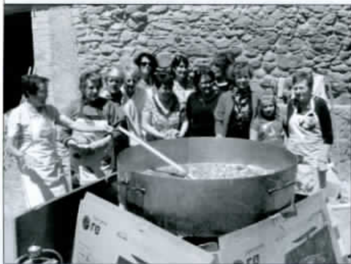
Las mujeres de Salas Bajas, cocinando el Recao de San Isidro