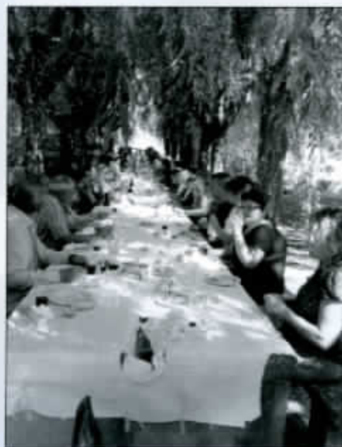
Comida popular Sto. Cristo del Plano