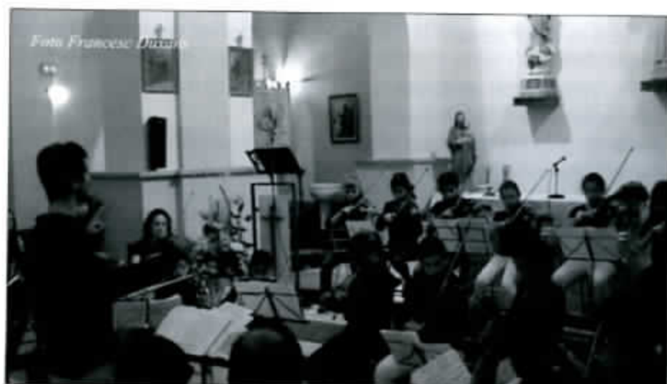
Concierto de los niños de la escuela de Música y Danza de Barbastro