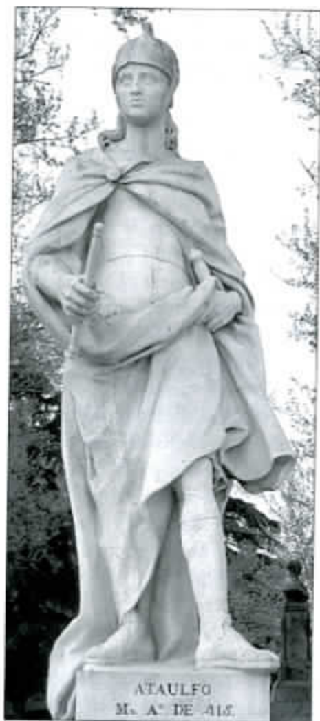
Ataulfo Ier. Rey visigodo Año 415

cluido con la Monarquía constitucional de los siglos XIX al XXI. En el examen histórico a nivel europeo, es constatable un proceso histórico de supresión de monarquías y la consiguiente aparición de repúblicas. Es lo que ha pasado en Europa con varios países (Francia, Italia, Austria, etc.). La pregunta que cabe hacerse es si este proceso debe ser considerado general o inexorable, es decir, si a medio o largo plazo todas las monarquías darán paso, o deberán dar paso, a repúblicas. Con respecto a esto, convendría hacer notar que las monarquías fueron desapareciendo por las connota-