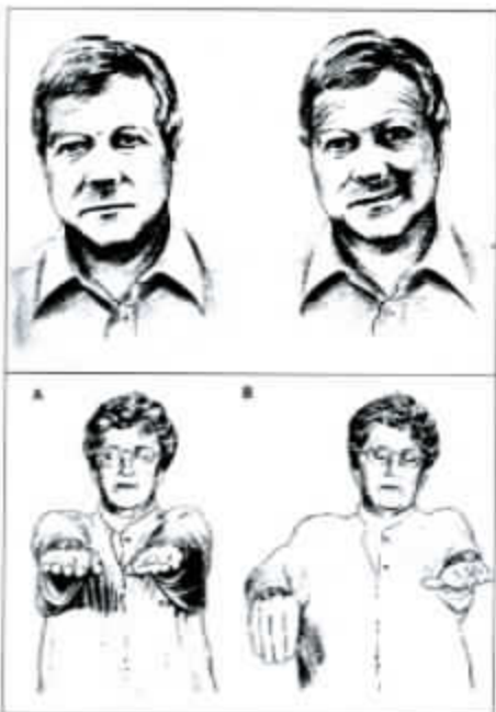
Figura 1 MEDIDAS DE PREVENCIÓN PARA EL ICTUS

• Anormal: Arrastra palabras, son incorrectas o no habla