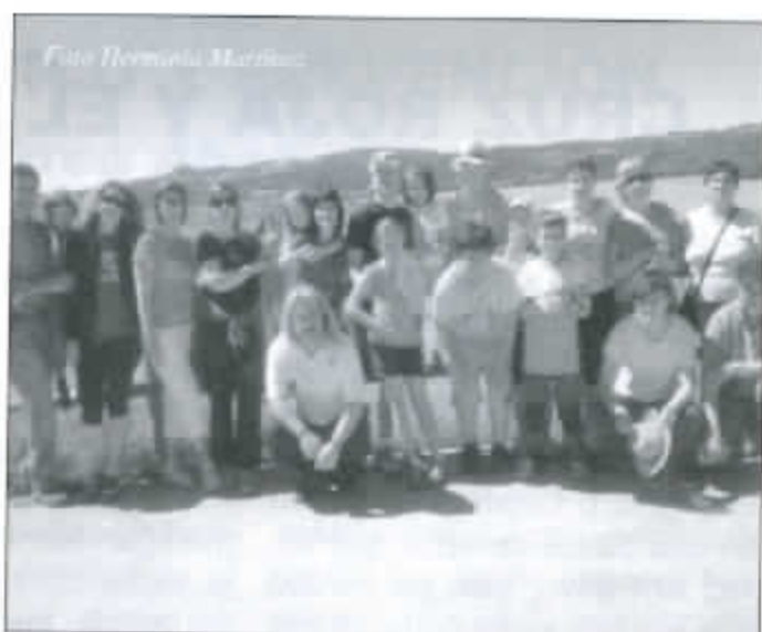
Andada a San Macario