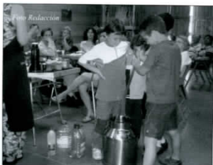
Dando vueltas al jabón