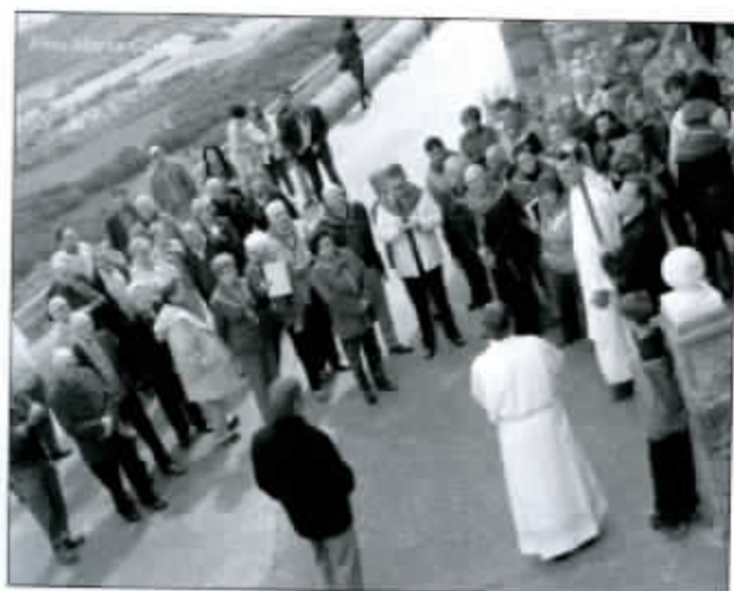
Romería al Pueyo