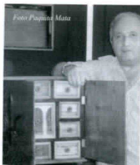
Exposición de tallas en madera de Carlos Carruesco