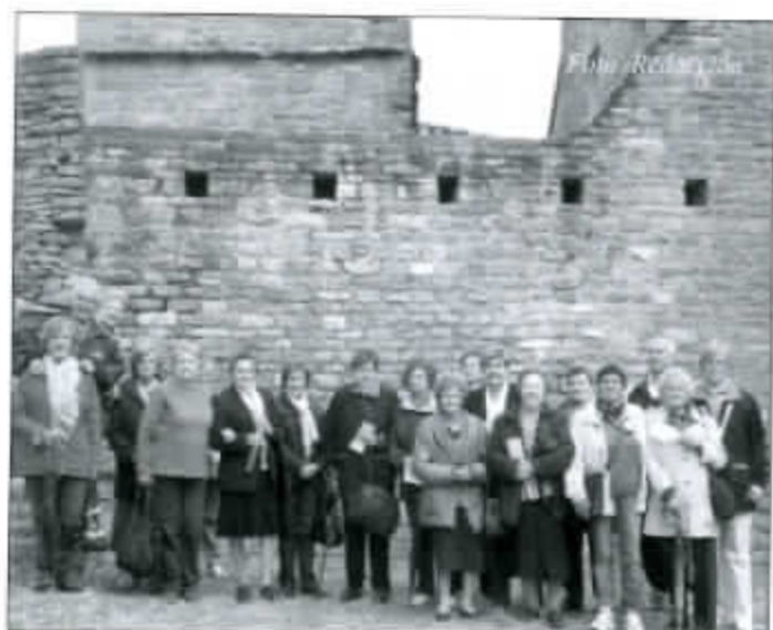
Parte de los viajeros en Abizanda